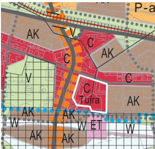
Kuva 5. Ote Uuden Oulun yleiskaavasta, kaavakartta 2.

Suunnittelualue on suurpiirteisesti rajattu oheisessa kuvassa valkoisella viivalla. Alueella on voimassa Uuden Oulun yleiskaava (2016), jonka kaavakartalla 2 alue on osoitettu merkinnällä C, pää-