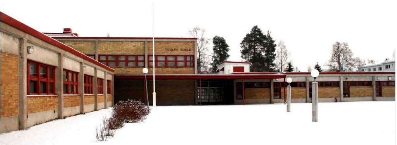
Kuva 4. Tuiran koulun laajennussiipi vuodelta 1974.

Merikosken päiväkotitoimi on yksikerroksinen ja vuodelta 1971. Kytkintie 7:n asuinkerrostalo on kaksikerroksinen ja vuodelta 1975. Päivittäistavarakauppa on yksikerroksinen ja vuodelta 2015.