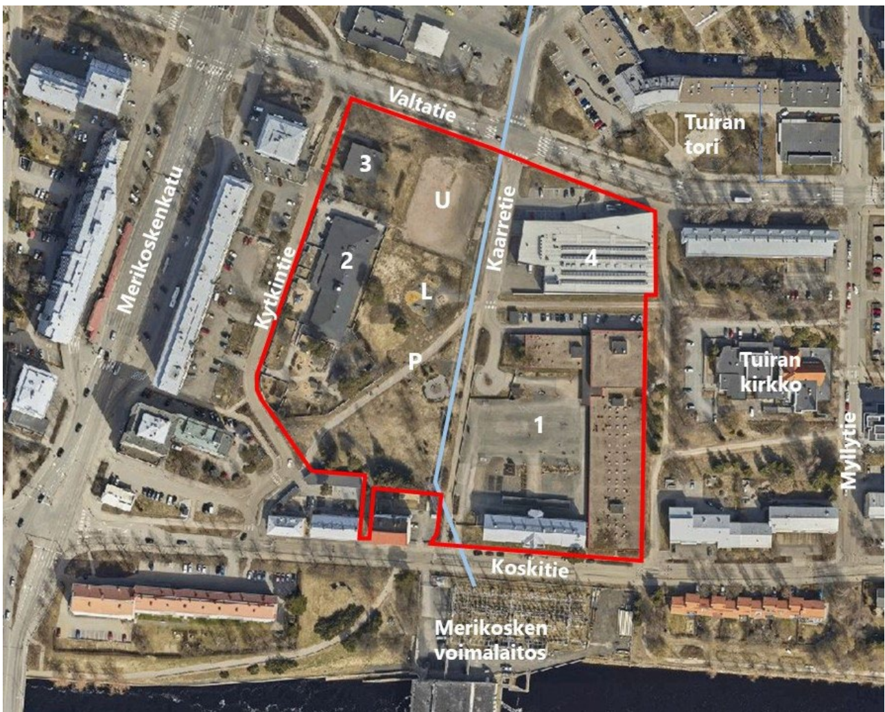
Kuva 2. Suunnittelualueen nykyinen maankäyttö.

Koskitien varrella sijaitsee Tuiran koulu (oheisessa kuvassa nro 1). Kytöntien varrella sijaitsee Merikosken päiväkoti (2) ja asuinkerrostalo (3). Kaarrettiellä Valtatien varrella sijaitsee päivittäistavara-kauppa S-market Tuira (4). Kortteleiden välissä sijaitsee Merikoskenpuisto (P), jossa ovat Merikosken leikkipuisto (L) ja urheilukenttä (U). Alueen poikki kulkee 110 kV:n voimalinja (keskilinja on kuvassa esitetty sinisellä viivalla). Kaavamuutosalue on kuvassa rajattu punaisella viivalla.