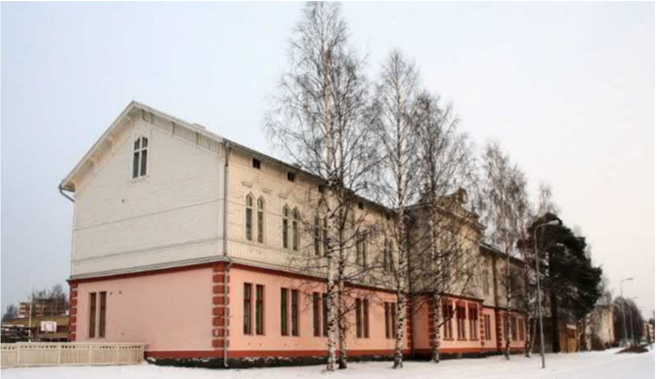
Kuva 3. Tuiran koulun vanhin osa vuodelta 1900. Ensimmäinen kerros on tiilirakenteinen ja toinen puurakenteinen.

Koulun yksikerroksinen uudempi laajennus on vuodelta 1974. Tämän tilalta purettiin vuonna 1973 jugend-tyylinen lisärakennus vuodelta 1911.